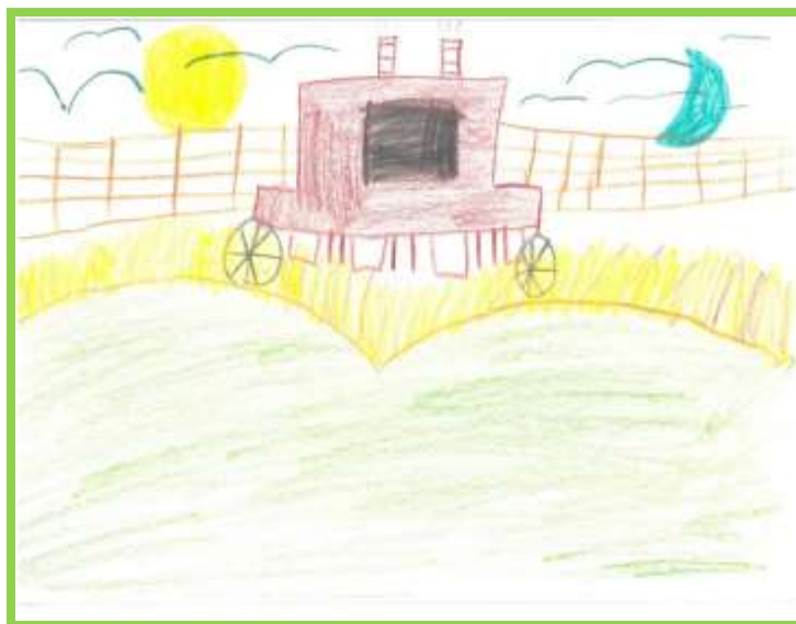
Œuvre de Charles Lessard

Il s'agit bien entendu d'une avenue inédite pour une politique culturelle municipale. Mais comme à Compton, on ne fait jamais les choses comme ailleurs, l'idée a rapidement pris racine.