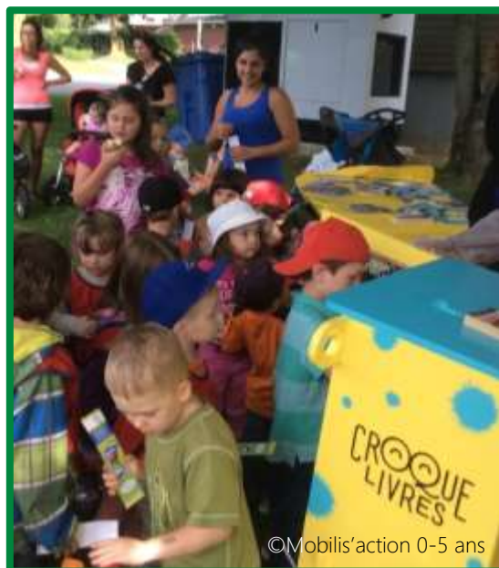
Le lancement du Croque-livres