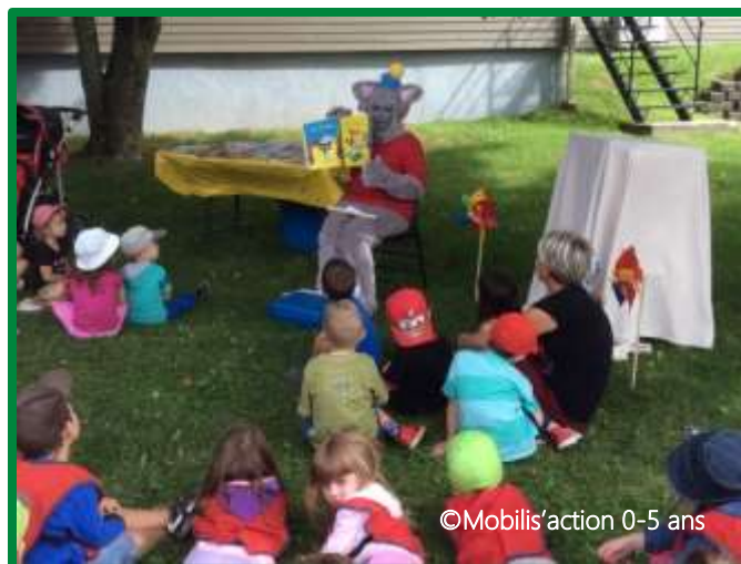
Une animation pour les tout-petits avec Brin d'ami

L'animation de la bibliothèque représente d'ailleurs un autre enjeu, puisque les citoyens, petits et grands, seront invités à s'approprier ce nouveau lieu d'échanges, de divertissement et d'apprentissage.