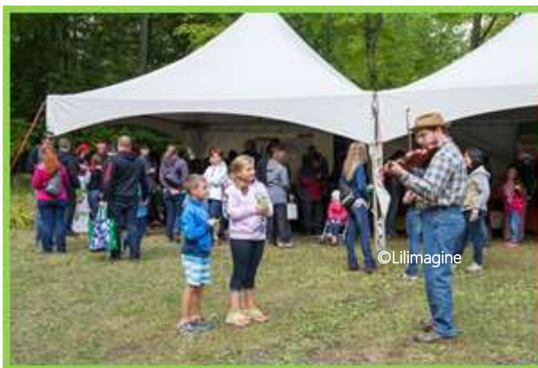
Violoniste aux Comptonales