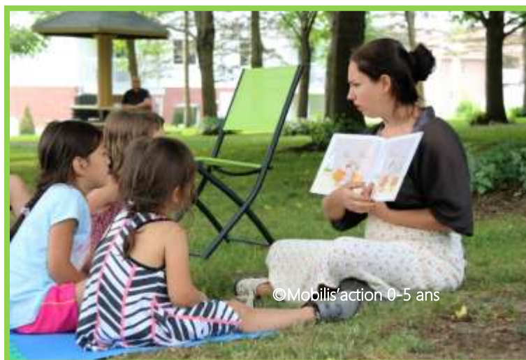
Les Contes de la fontaine